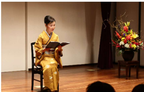
令和4年度文化庁芸術祭参加公演にて

これからの日本をより良いものにして行くために、伝統的日本文化や日本精神は失わず、そしてDX化で社会が変革する中で、デジタル技術を使いこなす能力はしっかり身に着け、両者を合わせ持つ人、つまり「和魂デジオ」とでもいえるような人に皆がなり、それぞれが得意分野で「和魂デジオ」を発揮して行くことで、より良い日本を、世界をつくっていこう。