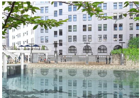
日本橋川に面した「日証館」前面の堤防の整備を提言