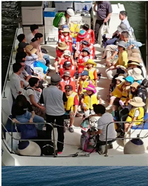
2019年のわくわくすいすい「水辺探検」の船上案内の様子

日本・東京に初めて来た外国人旅行者が船で東京港を通り、築地や臨海部の都市へ訪れる様子は考えただけでもわくわくする。東京の新しい大きな魅了となることは確実である。