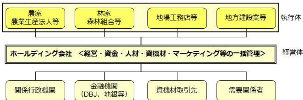
陸側のホールディング事業体のイメージ

このようなホールディング事業体については、陸側、海側でそれぞれ起こしうる。さらに言えば、流域圏に沿った山場 - 平場 - 海場が連携する形もありうる。海側（漁業）においては、既に、漁協がホールディング経営体的な機能を果たす方向で動き出している。陸側についてのイメージは次のとおりである。